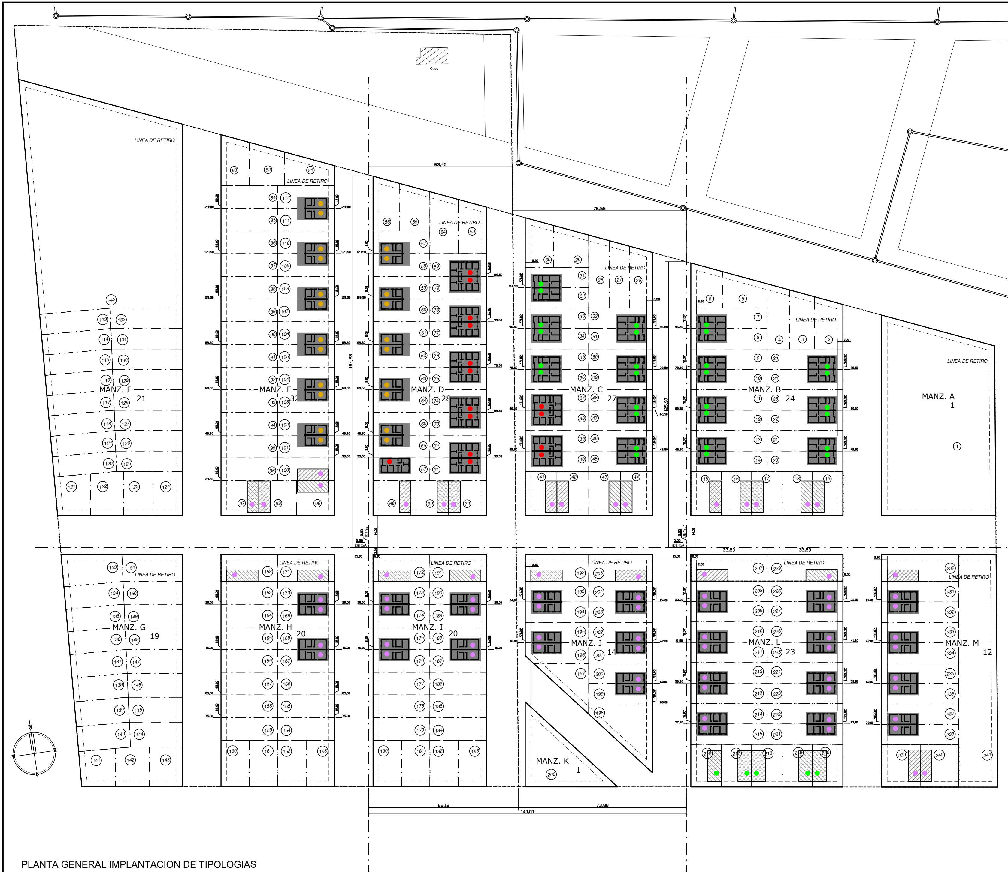
Plano Ubicación Escala: 1:7.500